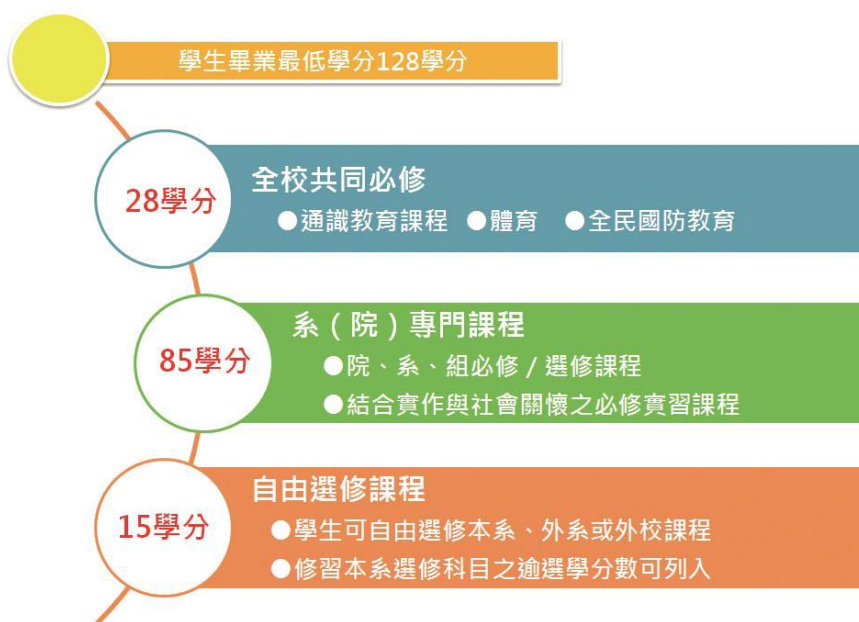
本校現行學分架構圖